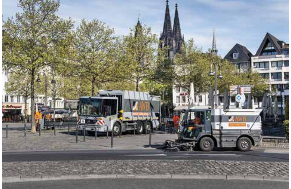
Wie viele andere deutschen kommunalen Betriebe stehen auch die AWB Köln aktuell vor der Herausforderung der Umstellung des Fuhrparks auf alternative Antriebe.

Basierend auf dem Umstellungsfahrplan wurde im Anschluss ermittelt, welcher Zubau der betrieblichen Ladeinfrastruktur in den nächsten Jahren erfolgen muss. Um ein Umparken der Fahrzeuge zu vermeiden und